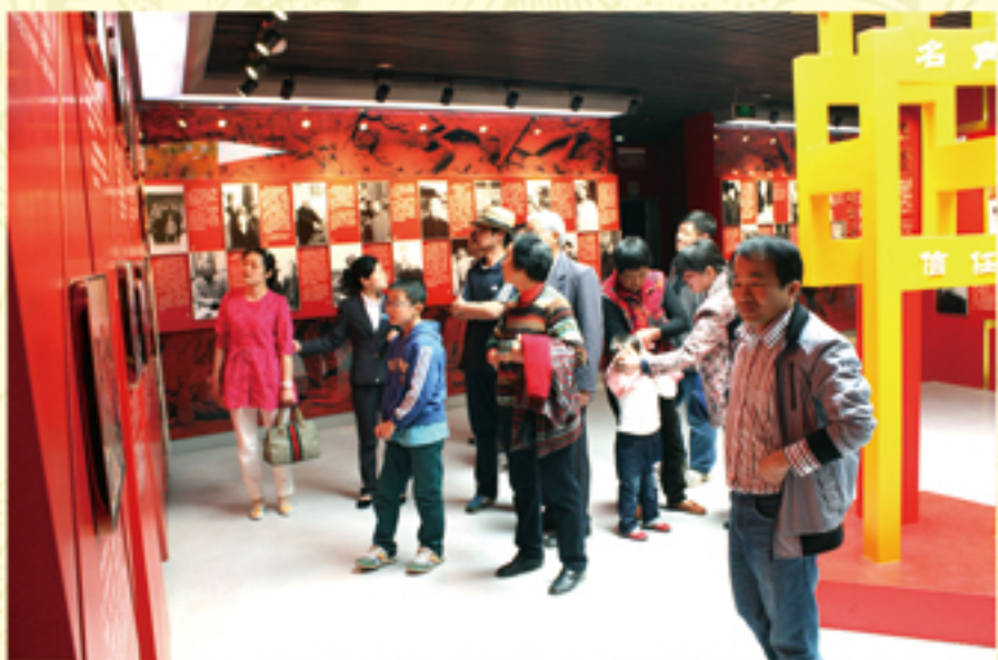
● 外地游客慕名参观