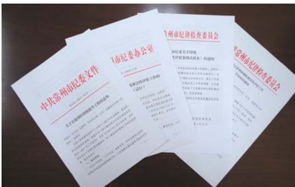
市纪委监察局出台的预防腐败工作相关文件

平台运行。在线办件88.3万余件，监察人员入网监察2401次，发现异常情况并发送督办通知书396份，受理投诉22件，建议15件，咨询179件。对系统进行改造升级，督促各部门做到行政权力事项“全上网、真上网”，进一步深化政务公开、提升行政效能。3月13日，我市“三合一”阳光政务平台顺利通过省检查考核组检查验收，带队领导给予充分肯定。