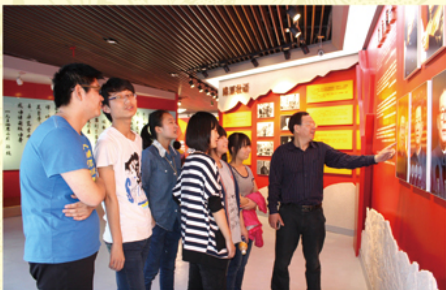
● 在校学生接受廉洁教育