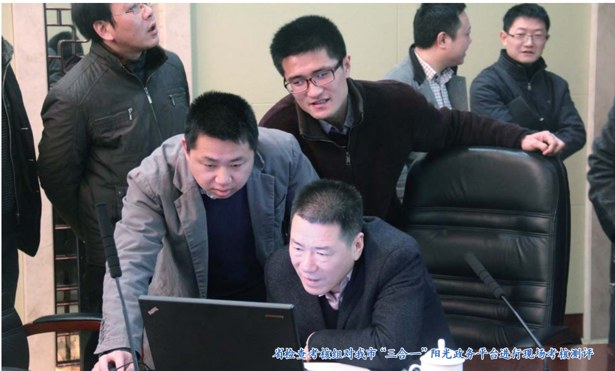
省检查考核组对我市“三合一”阳光政务平台进行现场考核测评

充分发挥“三合一”网络平台电子监察作用。今年一季度，我市48家市级机关的6530个行政许可、行政处罚等权力事项进入“三合一”阳光政务