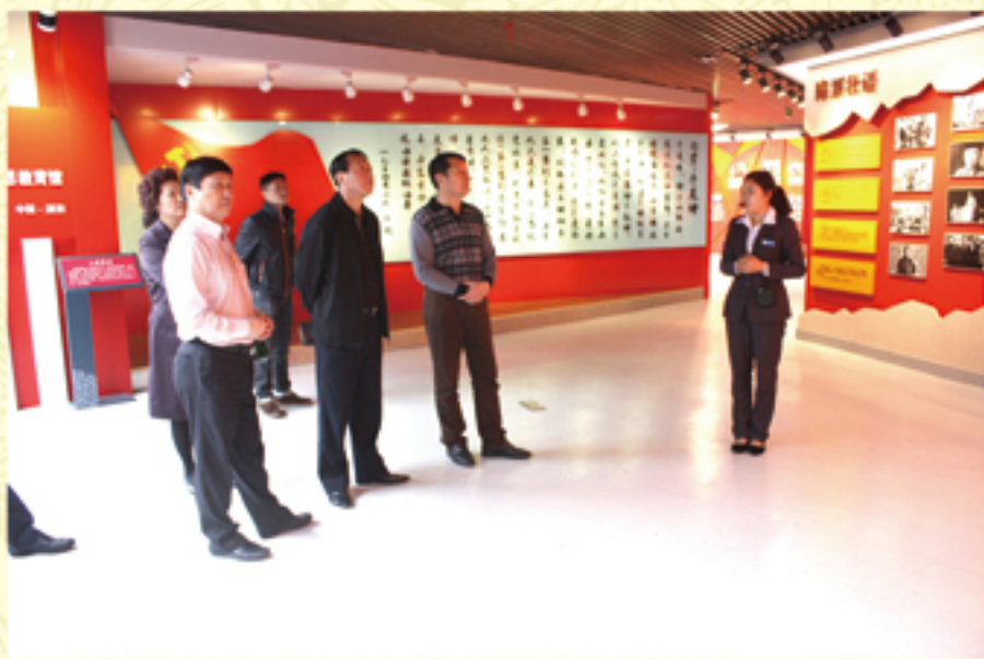
● 非公企业组织参观

新 四军廉洁思想教育馆开馆三年来，全国各地党员干部及各界群众纷纷前来参观学习， 已累计一百多万人次。