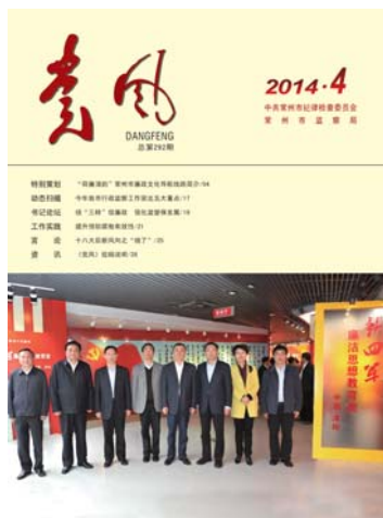
封面图片：市委常委会参观新四军廉洁思想教育馆