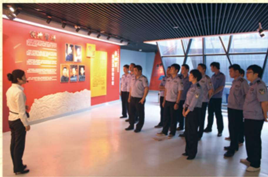
● 公安干警组织参观