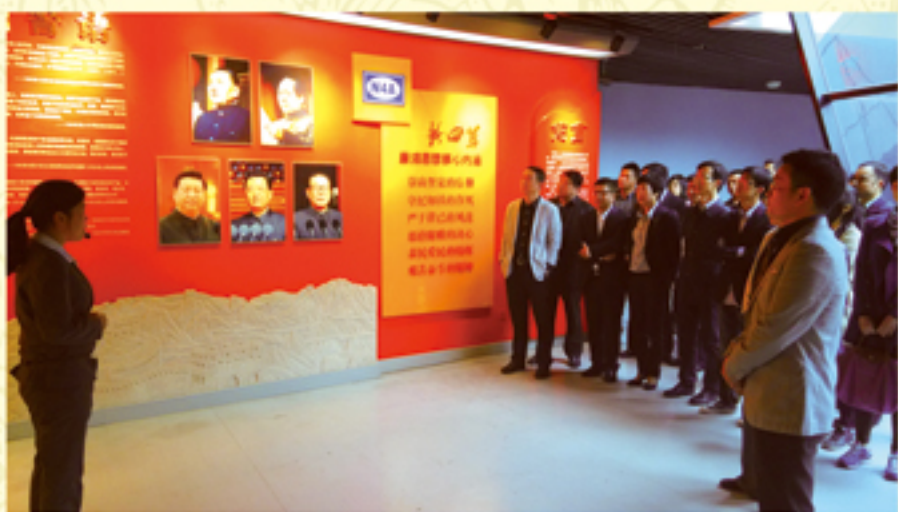
● 基层纪检干部参观