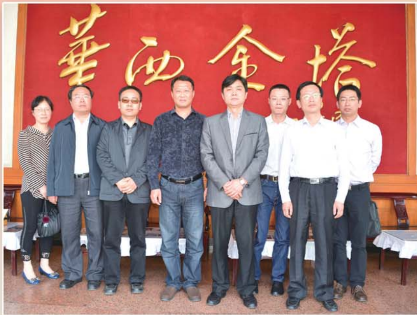
● 区纪委、监察局机关全体党员赴华西村学习吴仁宝先进事迹