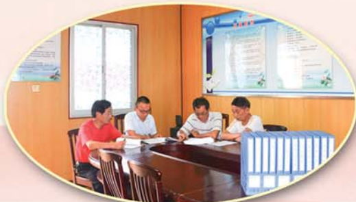
● 丁堰街道设立农村廉政风险防控室，确保村务监督有阵地