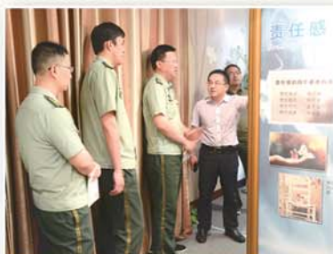
● 消防官兵到勤廉导师工作室开展主题教育