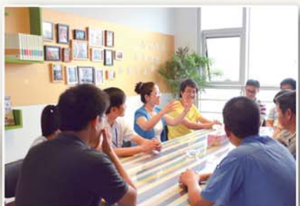
● 邀请勤廉导师开展自我成长团体辅导