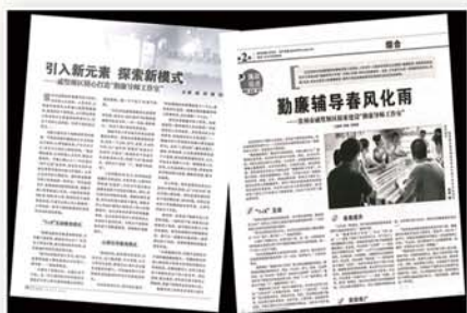
● 《中国纪检监察报》、《党的生活》大篇幅介绍勤廉导师工作室

勤廉导师（连锁）工作室自2012年启动建设以来，业已成为覆盖全区的勤廉宣教组合载体，成为公务员入职教育、入党培训、领导干部任职教育和党组织活动的重要基地，2013年底获得“江苏省廉政教育基地”殊荣。今年以来，戚墅堰区尝试将勤廉导师工作室与道德讲堂、双拥工作室“三合一”，与发挥“三支队伍”作用相结合，进一步放大工作室的教育功能和品牌效应，不断为其赋予新内涵、注入新活力。