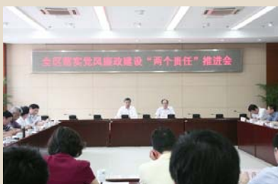
9月5日上午，钟楼区召开全区落实党风廉政建设“两个责任”推进会