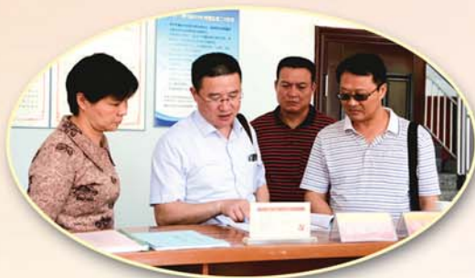
● 赴浙江海盐等地学习考察防范利益冲突机制先进经验