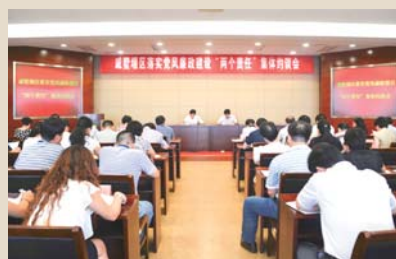
9月10日，戚墅堰区召开落实党风廉政建设“两个责任”集体约谈会