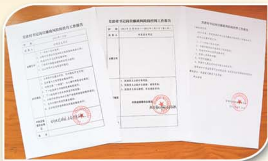
● 推行村书记廉政风险防控报告制度，实施全程留痕监控