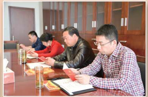
● 区纪委、监察局机关开展“重温党章、牢记使命”学习讨论活动