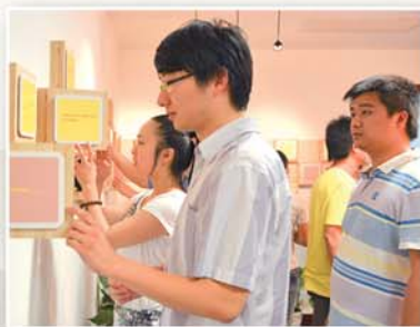
● 入党积极分子开展党的知识自我测试