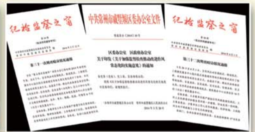
● 监督执纪问责，坚决纠正“四风”