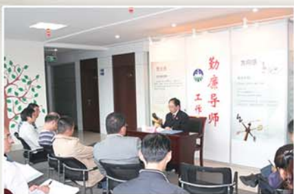
● 第四中学校长为师生宣讲“仁义礼智信”主题廉洁文化