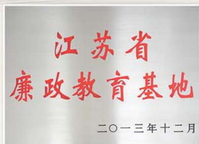
● 2013年12月，勤廉导师工作室被评为“江苏省廉政教育基地”