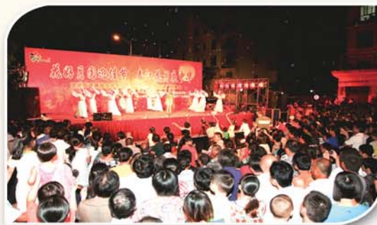
● 举办廉政文化进农村专场演出