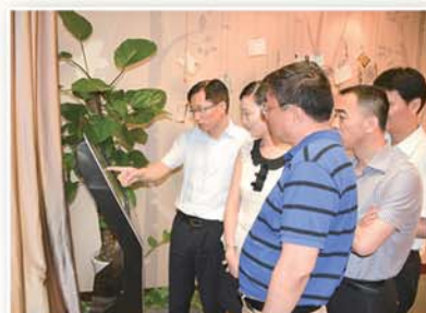
● 党员干部在勤廉导师工作室进行“心理体检”