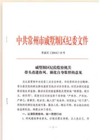
● 加强自身建设，锤炼过硬队伍

戚墅堰区纪委、监察局坚持高标准、严要求开展党的群众路线教育实践活动，确保“规定动作”做到位、“自选动作”显特色，用铁的纪律打造忠诚可靠、服务人民、刚正不阿、秉公执纪的纪检监察队伍。与此同时，积极履行党内监督专门机关职能，协助区委制定出台《关于加强监督检查推动改进作风常态化的实施意见》，以监督检查的制度化、规范化助推作风建设的常态化、长效化。