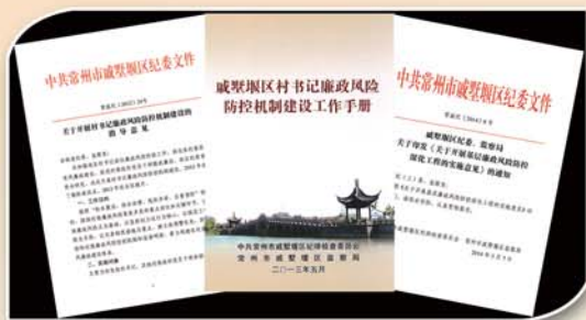
● 出台制度指导基层廉政风险防控工作

戚墅堰区在村书记廉政风险防控工作取得初步成效的基础上，大力实施基层廉政风险防控深化工程，将防控对象向基层站所负责人延伸，探索制定基层干部利益冲突回避办法，以规范权力运行为核心，以防控廉政风险为基础，以完善制度机制为重点，以强化执行措施为保障，加快健全完善在内控中规范、在阳光下运行、在网络上监督的“三位一体”廉政风险防控机制，扎牢制约基层权力的“制度之笼”。