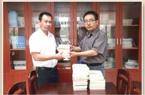
● 区纪委、监察局机关积极开展党员义工“365”活动，为结对社区捐建廉政图书角