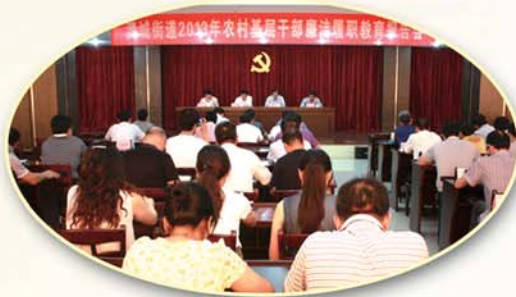
● 开展农村基层干部廉洁履职教育，增强廉政风险管控意识