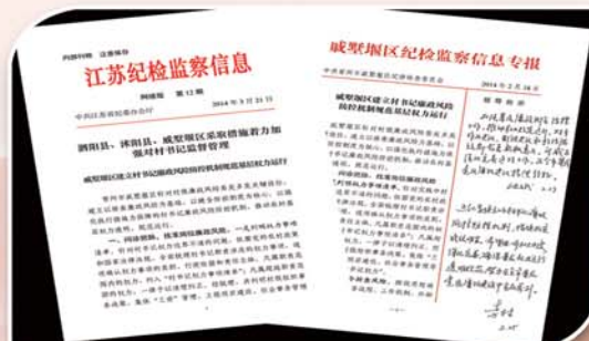
● 监督执纪问责，坚决纠正“四风”