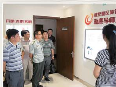
● 区城管局开展“中国梦、城管梦”勤廉主题教育活动