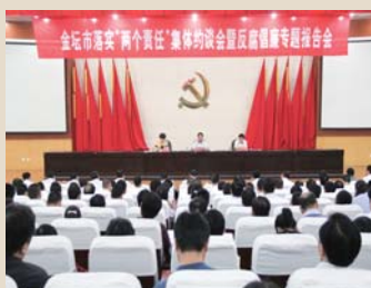
9月18日下午，金坛市委召开落实党风廉政建设“两个责任”集体约谈暨反腐倡廉专题报告会

戚墅堰区持之以恒推动改进作风常态化，切实做好国庆节期间作风建设 and 廉洁自律工作，对违规违纪行为发现一起，查处一起，绝不姑息。■