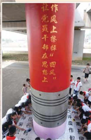
● 组织社区党员、群众开展巨型橡皮擦“四风”活动，营造良好社会氛围