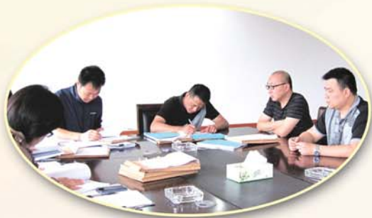
● 潞城街道出台并严格执行村级公有资金投资工程管理办法