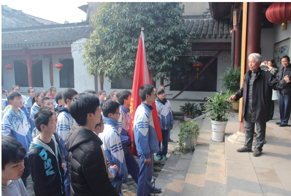
朝阳中学德育教育走进白氏宗祠