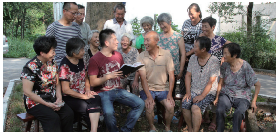
礼嘉镇信访听证会现场

今年以来，武进区纪委尝试引入信访听证会制度，责任单位及上访人多方参与，搭建了平等对话平台，把问题摆到桌面上来，充分听取各方观点，给当事人一个明白，最终达到息访罢访的效果。（缪小芬 陈雨谷）