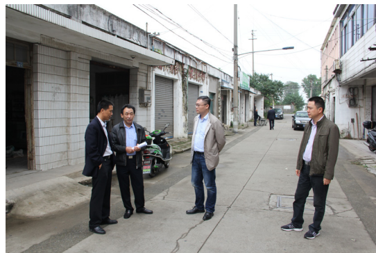
纪委工作人员走访动迁现场督查动迁政策落实情况，确保阳光动迁