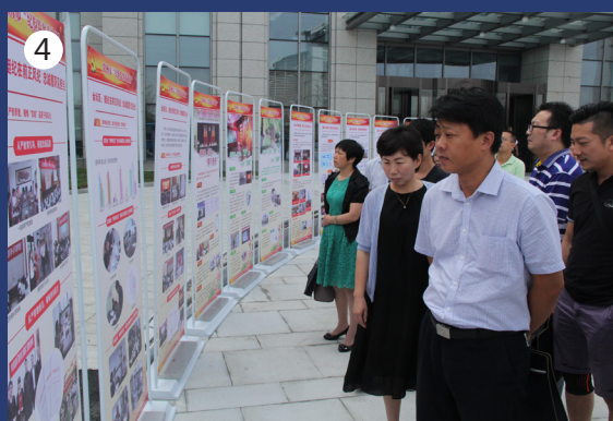
1 纪检监察开放日会场