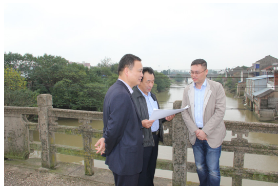
纪委工作人员在新孟河拓浚动迁现场督查项目推进情况