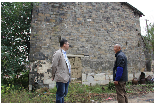
纪委工作人员走访群众了解动迁户对动迁工作的意见建议

转”要求，坚持纪律关口前移，突出问题导向，注重结果监督，通过播放警示教育片、督查项目推进、走村入户听取意见等方式，加强对新孟河拓浚工程的再督查再检查，为新孟河延伸拓浚工程的顺利推进打牢廉洁根基。(新纪宣)