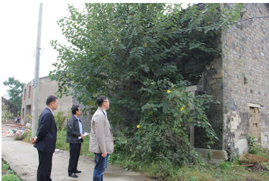
纪委工作人员走访动迁现场督查动迁政策落实情况，确保阳光动迁