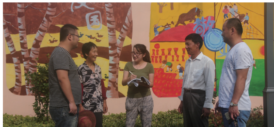
该区雪堰镇纪委工作人员走访群众

今年以来，武进区开展侵害群众利益的不正之风和腐败问题专项整治活动，把民生领域作为整治重点，通过驻点巡察、监督检查、专项审计等方式，监督基层权力让群众切实享受到反腐败成果。（缪小芬 许 燕）