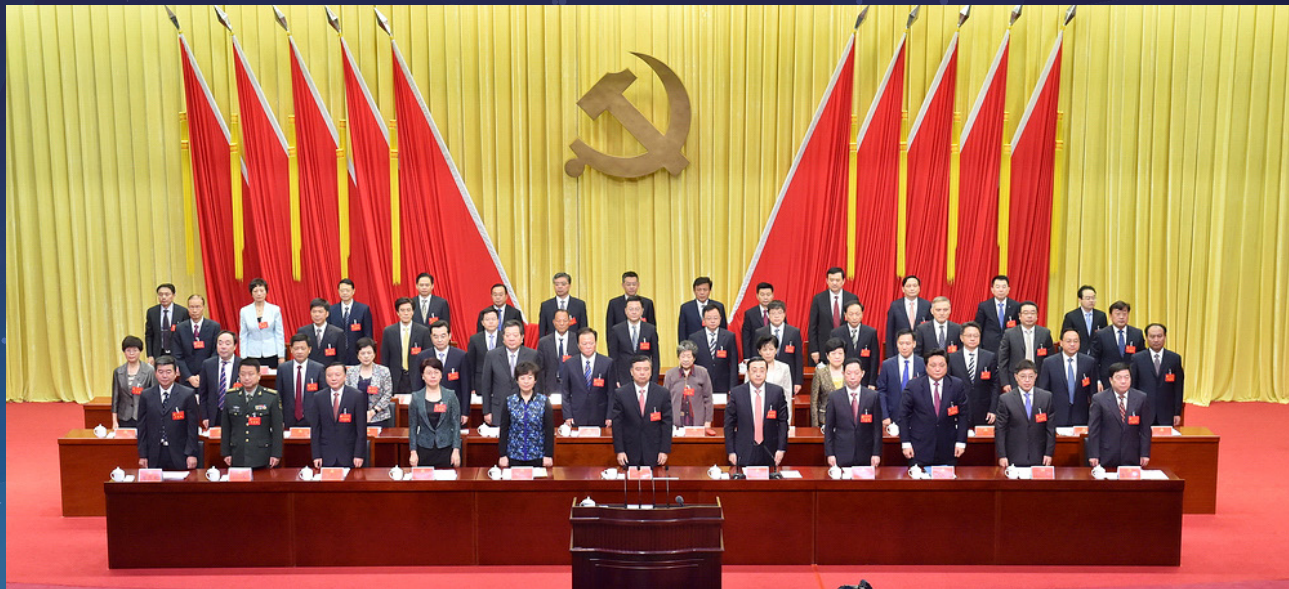
市第十二次党代会在国歌声中开幕