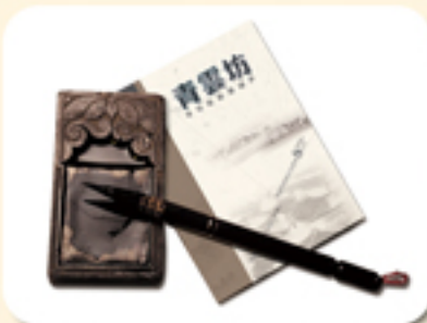
创办检察内刊《青云坊》