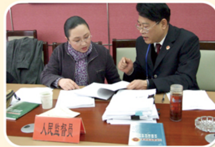
邀请人民监督员参加案件质量检查