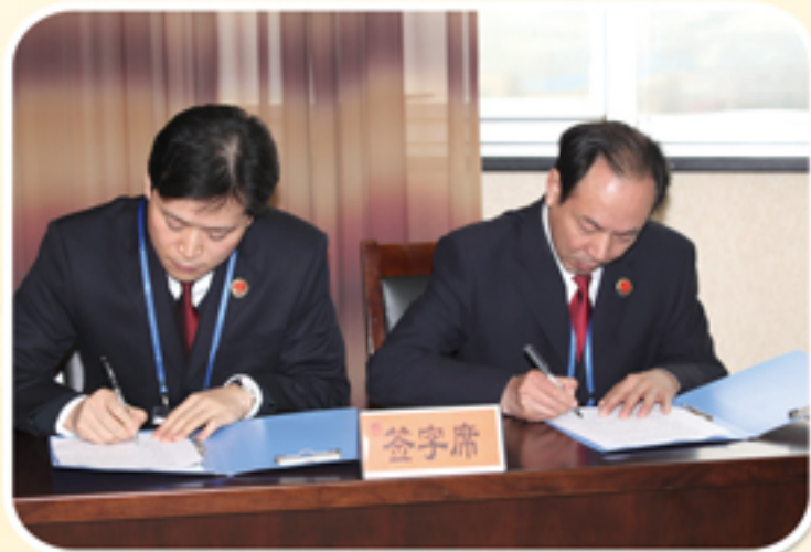
签订勤政廉政责任书