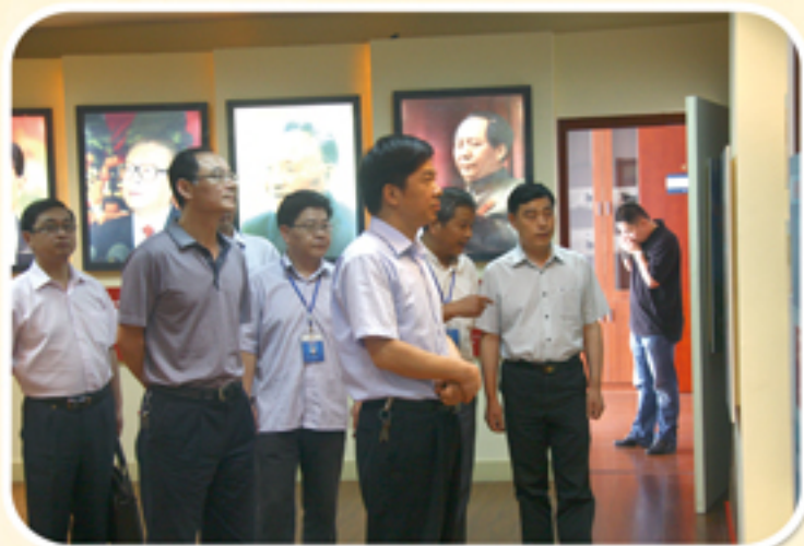
市纪委副书记石伟东参观青云坊检察官活动中心

近年来，钟楼区人民检察院始终将党风廉政教育和自身反腐倡廉建设作为长效工程常抓不懈，丰富载体阵地、筑牢廉政防线。坚持以制度管人管事，通过教育促廉、机制管廉、督察保廉，力戒“慵懒散”，昂扬“精气神”，全力营造风清气正的良好氛围。