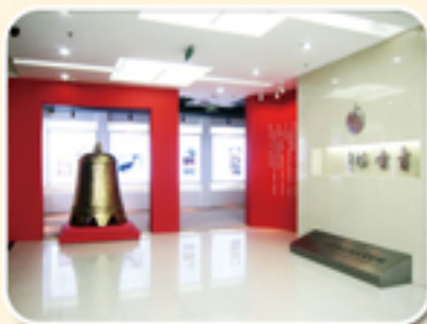
检察官文化活动中心“青云坊”