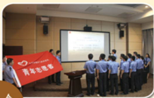
诚明志愿者服务队宣誓