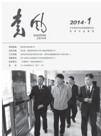
封面图片：省人民检察院检察长徐安到钟楼检察院视察指导工作