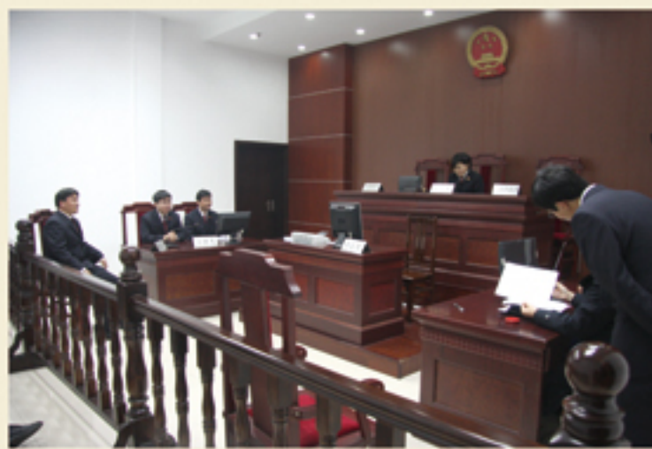
侦查人员出庭模拟练兵